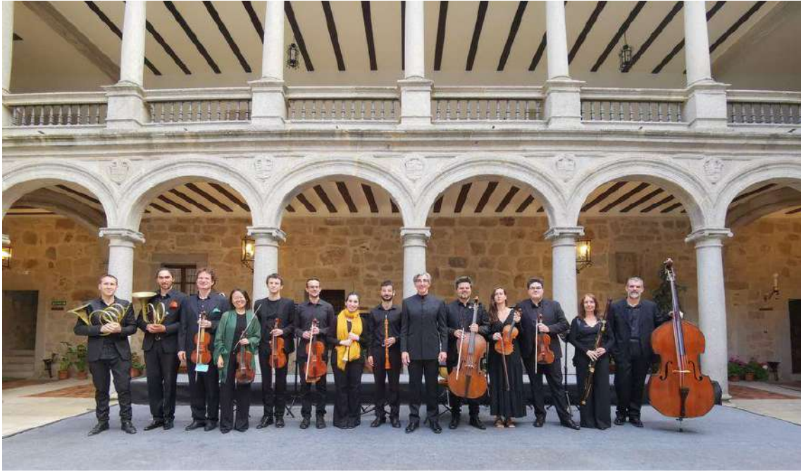
Camerata Antonio Soler